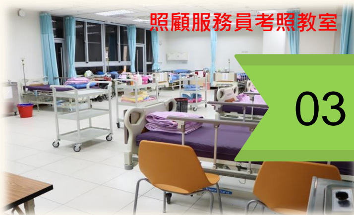
照顧服務員考照教室